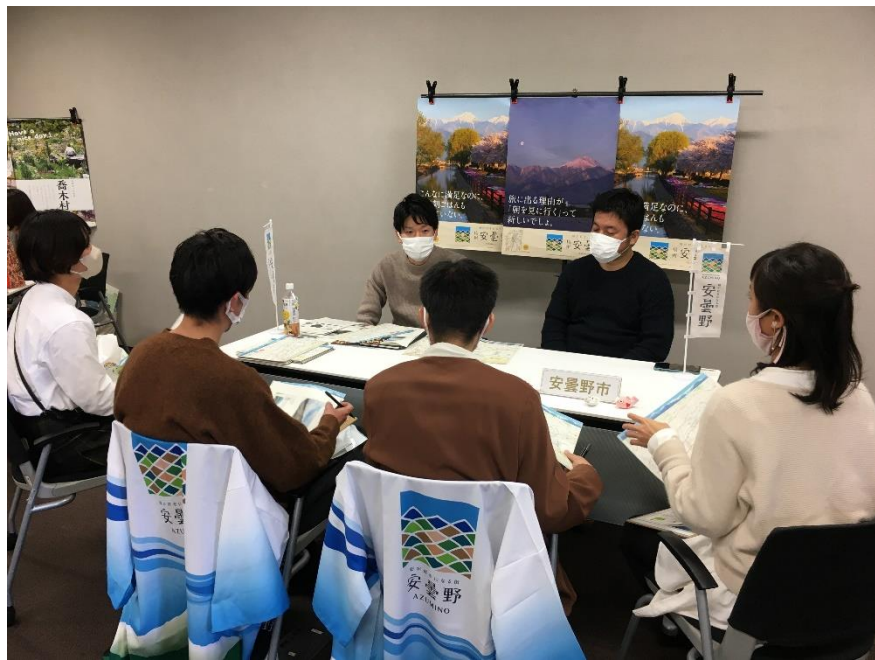
安曇野市 のブース